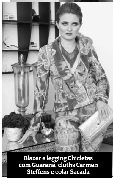
Blazer e leggings Chicletes com Guaraná, cluths Carmen Steffens e colar Sacada