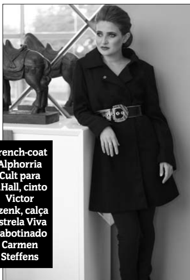
Trench-coat Alphorria Cult para V.Hall, cinto Victor Dzenk, calça Estrela Viva e abotinado Carmen Steffens