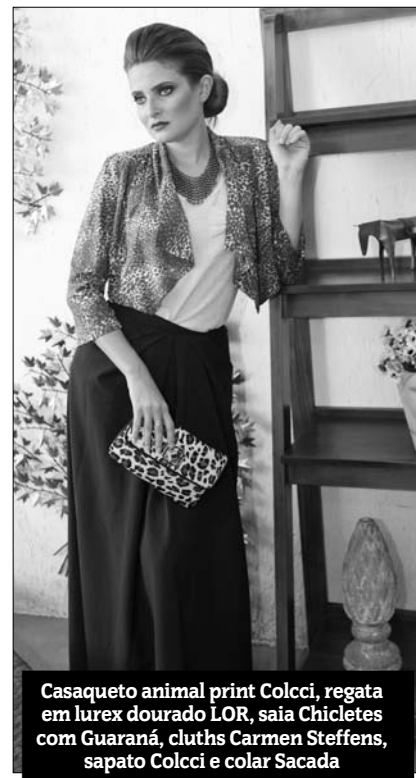
Casaqueto animal print Colcci, regata em lurex dourado LOR, saia Chicletes com Guaraná, cluths Carmen Steffens, sapato Colcci e colar Sacada