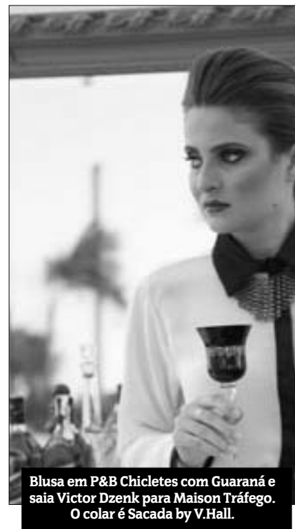
Blusa em P&B Chicletes com Guaraná e saia Victor Dzenk para Maison Tráfego. O colar é Sacada by V.Hall.