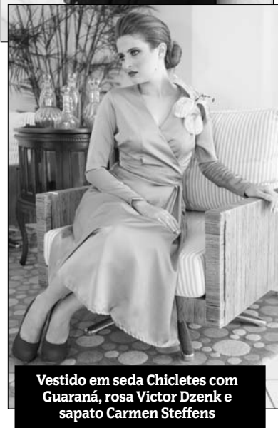
Vestido em seda Chicletes com Guaraná, rosa Victor Dzenk e sapato Carmen Steffens